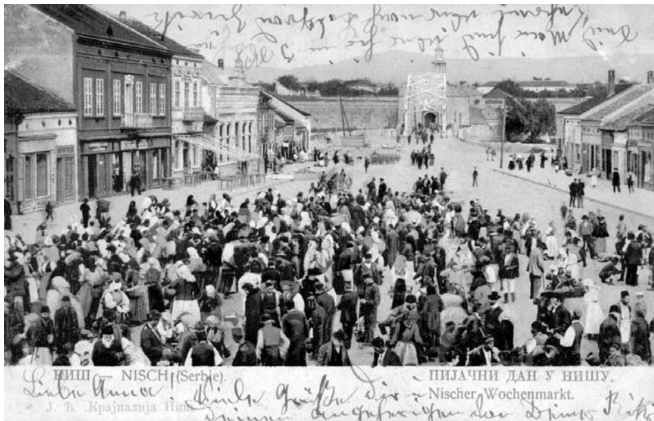
Сл. 19 Главна пијаца, крај XIX века

Најживљи је дан у Нишу субота – дан пазарни!