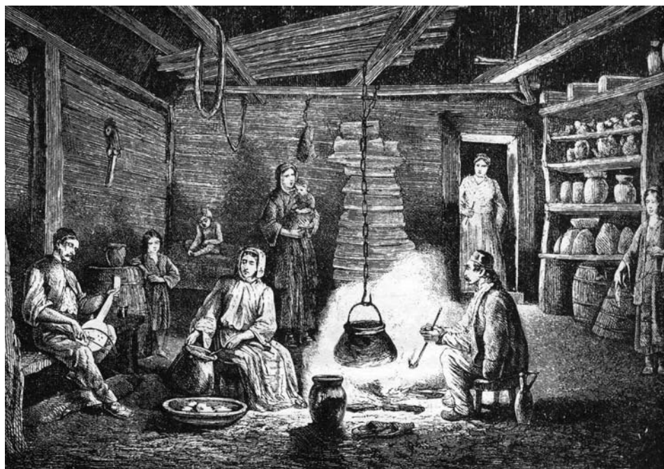
Сл. 20 У кући српског домаћина, околина Ниша, према Ф. Каницу, друга половина XIX века

Зађите по селима да видите како спавају и настављају наше вајне газде, којима се ломе шљиве од рода, а тесни торови и обори од добре стоке и који имају земље да би могли пркосити каквом немачком херцогу!