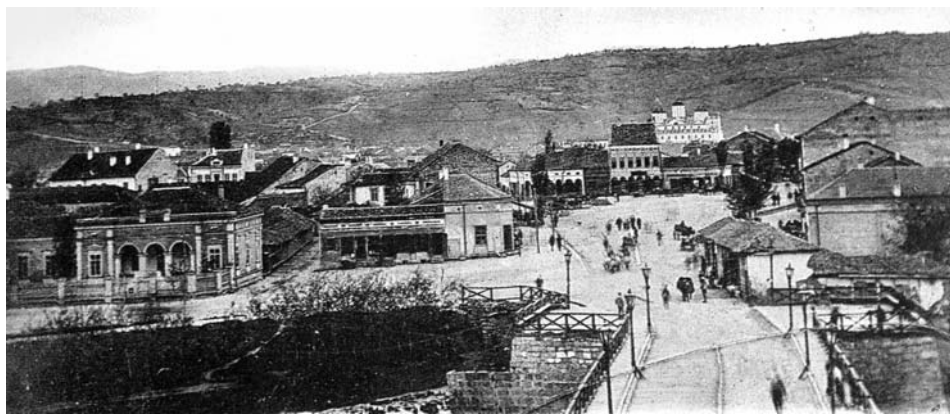
Сл. 12. Ниш с краја XIX века, шир̄ краља Милана

Осем ових гостионица има доста кафана и кафаница, почев од моста па до Саборне цркве, где се скупљају људи ујутру, у подне и увече на разговор и који био напитака – каве, ракије, вина, пива, соде па и обичне – воде!