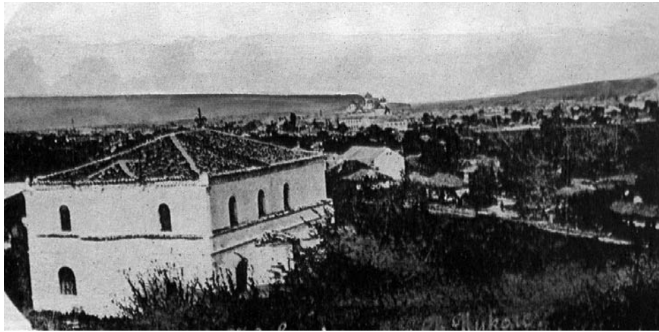
Сл. 16 Црква Св. Николе, крај XIX века

иконостас (темпло) спрам своје величине како јој личи. Неки говораху још да ће се на исту цркву назидати звонара.