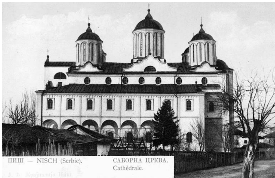
Сл. 15 Саборна црква, крај XIX века

У Нишу има неколико цркава. Саборна, једна код саборне стара пола у земљи, свети Никола крај вароши и св. Пантелија иза вароши и града преко Нишаве. Најлепша је, без сумње, Саборна црква. Ту се свршавају све торжанствености. Штета само што ова црква још нема