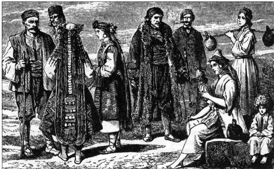
Сл. 13 Нишлије и Нишлијке, друѓа њоловина XIX века, њрема Ф. Каницу

Нишлија је и у јелу и оделу чуваран. Нема излишних ствари на рафу ни на тавану. То је узрок, те онај, који мора дуго да седи у Нишу, не може да се опрости кафанске ларме и вике и да нађе где у приватној кући стан, ма како да плаћа. И ако се тако што деси, то се може код пријатеља или код којег од оних, који су се доцније иза старе границе доселили. – Прекодан Нишлија ради и седи – а увече кући на одморак. Празником ће изаћи где у околину на "теферич", било у Сићево, у Бању, у Јелашницу, у манастир Габровац или где на друго место. Млого имају своје винограде на "Горици", куда лети и јесени иду.