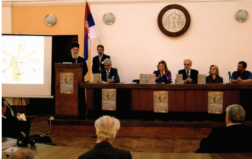
Сл. 1 Владика нишки, сада Његова Светост Патријарх српски Господин Иринеј, Отварање симпозијума Ниш и Византија VIII, сала Универзитета у Нишу, 3. јун 2009. Fig.1 Bishop of Niš, now His Holiness Serbian Patriarch Irinej. Opening of the symposium “Niš and Byzantium VIII”, Hall of the University in Niš, 3 June, 2009

Од доласка епископа Иринеја на чело нишке епархије многе цркве су обновљене и изнова изграђене. Велики број значајних књига, компакт дискова и телевизијских емисија, као и сваки почетак рада византолога на симпозијуму „Ниш и Византија“ заједно са зборницима радова, реализовани су уз благослов Његове Светости Патријарха српског Господина Иринеја.