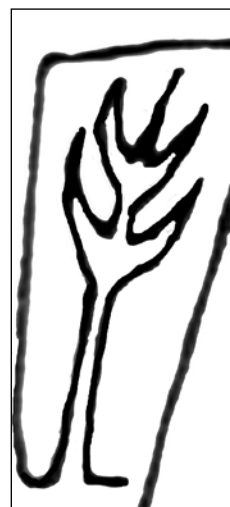
Сл. 2. Оловни тег, детаљ орнамента Fig. 2 Leaden pendulum, a detail of the ornament

Предмет представља оловни тег у облику минијатурне амфоре у чију је доњу половину угравиран двозони геометријски орнамент. У орнаменту доње зоне уклопљена су слова PIN и стилизована палмова гранчица. 29 (Сл. 1 и 2)