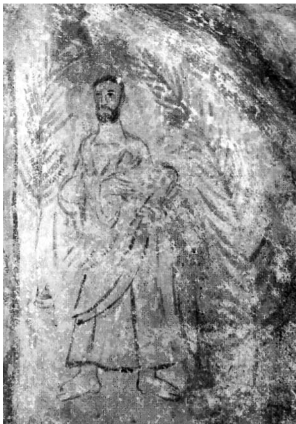
Fig. 5 The crypt with figural presentations, eastern wall, a detail with the palm branch, the southern figure, the National Museum of Niš

После десетак година Арије на Балкану има своје присталице. Један од њих је епископ Наисуса Киријак (Cyrilicus a Naisso), 34 који је наведен у енциклопедији отпадничког сабора, пре сабора у Сердци (Софија) 343. године. Из истог документа сазнајемо да му је за наследника одређен Гаудентије (Gaudentius a Dacia de Naiso, Gaudentius Naisitanus) који је присталица православног исповедања вере. Као епископ, Гаудентије је повратио звања оним свештеницима које је Киријак свргнуо. Посебно је активан у формирању канона усвојених на Сабору. Године 331, на сабору у Сирмијуму се спомиње неки Гаудентије, који је донекле променио своје ставове (Писмо папе Либерија, Pro deifico timore, Hilaire, Fr.fis., XVI). Могуће је да је Гаудентије био мртав пре друге половине IV века, јер га је, без посредовања титулара, заменио Бонос. 35