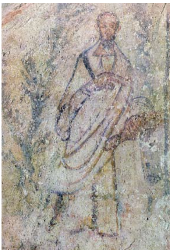
Сл. 4. Гробница са фигуралним представама, источни зид, детаљ са граном палме, северна фигура