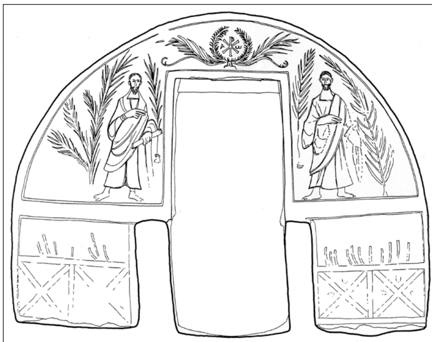
Сл. 3. Гробница са фигуралним представама, Источни зид гробнице, цртеж Б. Пешић