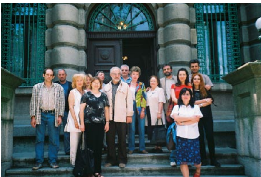
Сл. 4. Учесници научног скупа Figure 4. Symposium participants

заснивали на сазнањима до којих је дошао Габријел Мије. Репрезентативни изглед и научни елитизам Зборника Радова санишког симпозиума мора се одржати, чему доприноси и његова презентација на сајту града Ниша: http://news.nis.org.yu/doc/p-konstantin.phtml