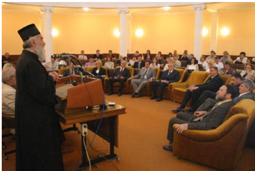
Сл. 1. Отварање научног скупа, Благослов Епископа нишког Господина Иринеја Figure 1. Opening of the Symposium, the blessing of Reverend Irinej, Bishop of the Niš Eparchy

оригиналних цртежа и фотографија Габријела Мијеа из збирке Института Габријела Мијеа при Сорбони.