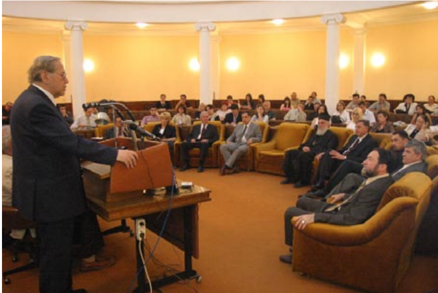
Сл. 3. Отварање научног скупа, академик Цветан Грозданов Figure 3. Opening of the Symposium, academician Cvetan Grozdanov

свет почео да мења мишљење о Византији, организована је изложба Византијске уметности у Паризу. Српска уметност је представљена копијама фресака и фотографијама које је одабрао Габријел Мије. Био је то избор сачињен од знања, добре воље и љубави.