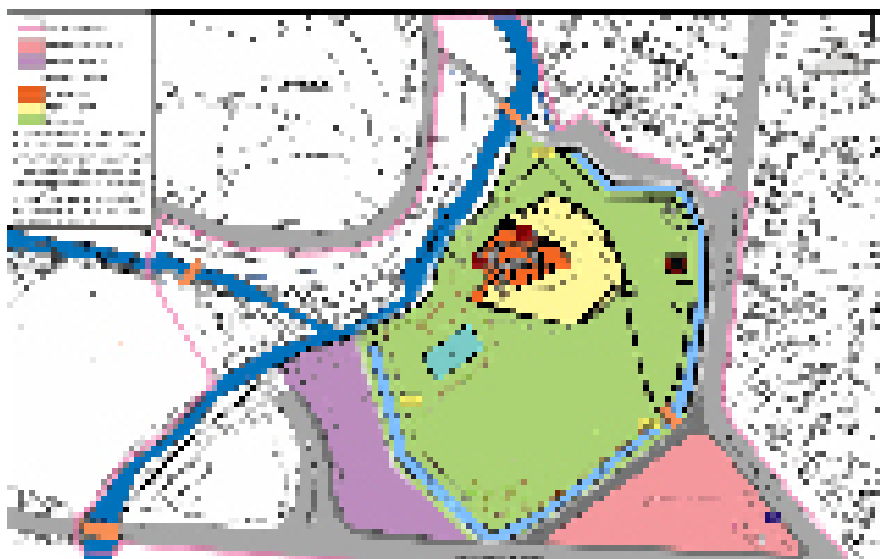
Сл.1 Пиротски град, ситуациони план