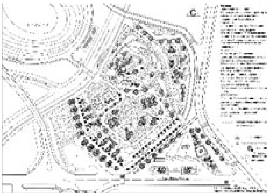
сл.4. Пиротски град, Предлог уредјења