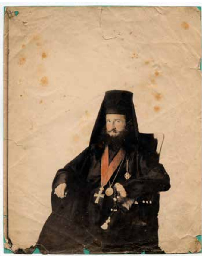
Fig. 1. Anastas Jovanović, Metropolitan Mihailo, coloured calotype, 1852-53, Belgrade City Museum

Лик митрополита Михаила је континуирано пласиран током друге половине 19. и почетком 20. века. Рани пример визуелне репрезентације митрополита Михаила представља седећи портрет у медију бојене талботипије из 1852/1853. године. 20 (сл. 1). Церемонијални трочетвртински портрет је извео знаменити уметник Анастас Јовановић, први српски фотограф и дворуправитељ кнеза Михаила Обреновића. 21 Највероватније настала у садејству уметника и митрополита, овај портрет представља режирани приказ достојанствене особе у пуноћи његовог социјалног статуса. Приказ митрополита са ордењем на прсима и бројаницом у левој руци постао је основни модел за разнолике варијације његових портретних представа.