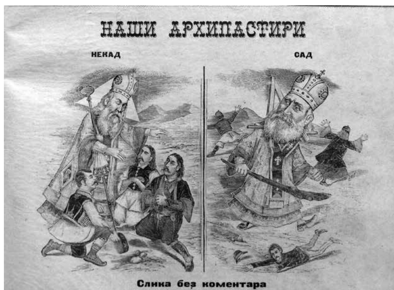
Fig. 6. Ours Archpastors, Gedža no. 33, 26 September 1893, National Library of Serbia

бао бити уручен Скопском митрополиту Фирмилијану. Стајић је без сликаревог одобрења наложио да се светитељев лик масовно умножи и дистрибуира за школе у Србији. 32 Незадовољни сликар сведочи да је поред тога, књиџар дао да се измени лик Светог Саве, који је по накнадном виђењу митрополита Теодосија Мраовића исувише личио на лик митрополита Михаила, изазвавши незадовољство код потоњег митрополита. 33