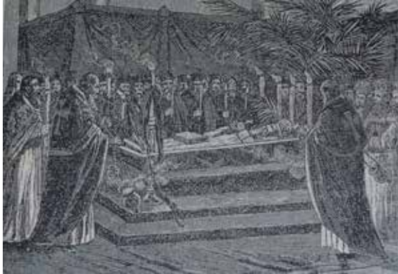
Сл. 9. Митрополит Михаило на одру у Саборној цркви у Београду, Српски народни илустровани велики календар за 1899. годину , Нови Сад 1898, 41, Завичајно одељење Библиотеке града Београда

Fig. 9. Metropolitan Mihailo on Deathbed in Belgrade Cathedral, Serbian National Illustrated Calendar for 1899 , Novi Sad 1898, 41, Local History Department of Belgrade City Library