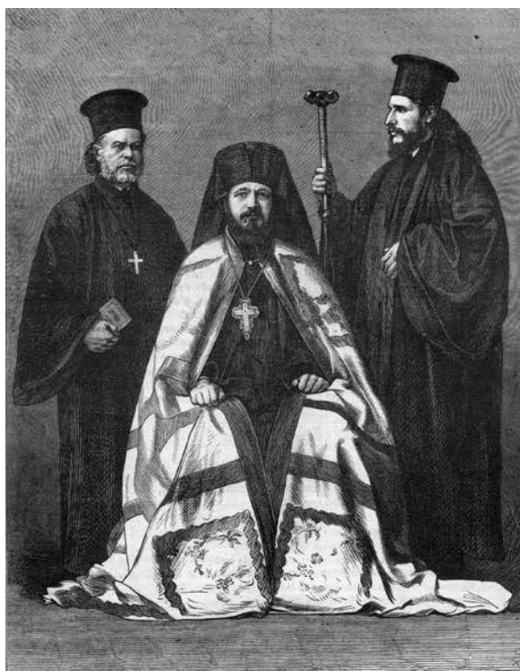
Сл. 2. Митрополит Михаило, L'univers illustre , 30. септембар за 1876. годину, преузето из књиге Балканска ружа ветрова , Београд 2007, 287.