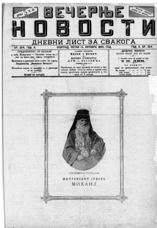
Сл. 3. Митрополит Михаило, Вечерње новости , бр. 284, 14. октобра 1894.