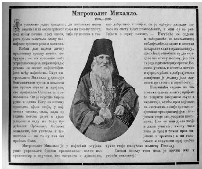
Сл. 7. Митрополит Михаило, Босанска вила 4, 28. фебруар 1898, Народна библиотека Србије