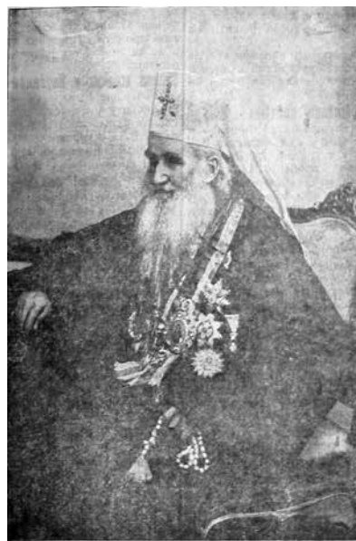
Сл. 13. Митрополит Михаило, Вечерње новости 36, год (5. 2. 1908), Народна библиотека Србије