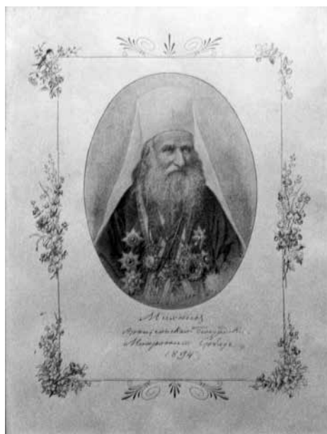
Сл. 4. Митрополито Михаило, литографија, након 1895., Саборна црква у Неготину