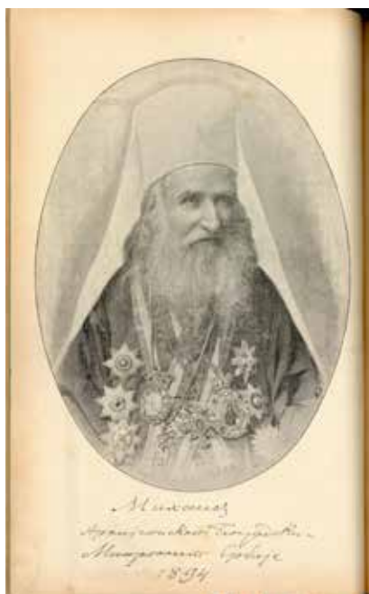
Сл. 8. Митрополит Михаило, Весник Српске цркве, Весник српске цркве 2, (фeбруар 1899), Библиотека Патријаршије Српске православне цркве

Током последње деценије двадесетог века дошло је до креирања и недовољне слике митрополита Михаила. У сатиричном листу Геца пласирана је негативна представа митрополита. Политички обојен лист, близак политичком програму радикала, објавио је низ карикатуралних митрополитових представа које су физиогномски хипертрофирале његов лик. Визуелни приказ Геце, народног и малог овоземаљског јунака, 41 материјализовао је отпор према однарођеним системима државне моћи (државна и црквена управа). Упечатљив двојни приказ светог Саве и посредно приказаног митрополита Михаила потврђује изнету тезу. (сл. 6) Насупрот иделизованог некадашњици, оличеној у канонској представи Свети Сава благосиља српцад , митрополит са батином у руци представља метафору актуелне црквене организације, и указује на њену корупцију и световни карактер. 42 Приказ митрополита Михаила са батином исказује негативно виђење цркве у целини од стране атеистички и анархистички настројених интелектуалаца. 43