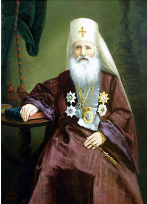
Сл. 5. Рафаило Момчиловић, Митрополит Михаило, уље на платну, 1896, Народни музеј у Београду