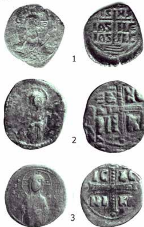
Табла 4: 1) Роман III Аргир (1025—1028.) анонимни фолис, Завичајни музеј Алексинац, налазиште, Градиште, Врћеновица. 2) Константин IX Мономах (1042-1050.) анонимни фолис, приватна колекција, непознато налазиште, околина Алексинца. 3) Константин IX Мономах (1042-1050.) анонимни фолис, приватна колекција, налазиште, Градиште, Гобелја-Брус.

Panel 4: 1) Romanus III, Argyrus (1025—1028.) anonymous follis, Heritage Museum Aleksinac, site, Gradište, Vrćenovica. 2) Constantine IX Monomachos (1042-1050.), anonymous follis, private collection, unknown site, surroundings of Aleksinac. 3) Constantine IX Monomachos (1042-1050.), anonymous follis, private collection, site, Gradište, Gobelja-Brus.