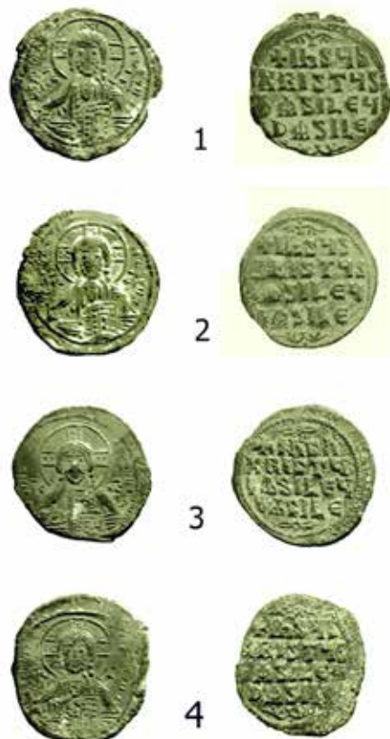
Табла 3: 1) Василије II (976-1050/5.) анонимни фолис, приватна колекција, налазиште, Градиште, Рујевица. 2) Василије II (976-1050/5.) анонимни фолис, приватна колекција, налазиште, Градиште, Рујевица. 3) Василије II (976-1050/5.) анонимни фолис, приватна колекција, налазиште, Градиште, Рујевица. 4) Василија II (976-1050/5.) анонимни фолис, приватна колекција, налазиште, Градиште, Рујевица.

Panel 3: 1) Basil II (976-1050/5.) anonymous follis, private collection, site, Gradište, Rujevica. 2) Basil II (976-1050/5.) anonymous follis, private collection, site, Gradište, Rujevica. 3) Basil II (976-1050/5.) anonymous follis, private collection, site, Gradište, Rujevica. 4) Basil II (976-1050/5.) anonymous follis, private collection, site, Gradište, Rujevica.