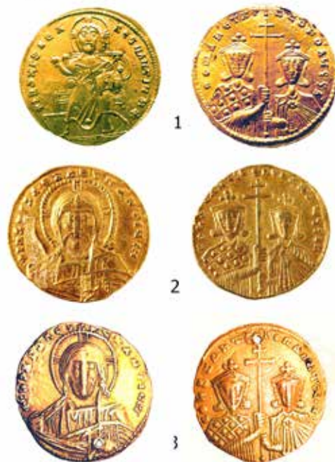
Табла 2: 1) Константин VII (913-959) и Роман I Лакапин (920-944), солид, откуп Народног музеја Крушевац, непознато налазиште. 2) Константин VII (913-959) и Роман II (959-963), солид, Народни музеј Крушевац, налазиште црква св. Духа, Град Сталаћ. 3) Константин VII (913-959) и Роман II (959-963), солид, приватна колекција, непознато налазиште.

Panel 2: 1) Constantine VII (913-959) and Romanus I Lakapenos (920-944.), solidus, National museum Kruševac, unknown site. 2) Constantine VII (913-959) and Romanus II (959-963.), solidus, National museum Kruševac, site, church Holy Spirit, Grad Stalać. 3) Constantine VII (913-959) and Romanus II (913-959.), solidus, private collection, unknown site.