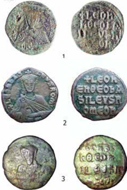
Табла 1: 1) Лав VI (886-912.), фоллис, Народни музеј Крушевац, налазиште Укоса, Град Сталаћ. 2) Лав VI (886-912.), фоллис, приватна колекција, непознато налазиште, околина Соко Бање. 3) Лав VI (886-912.), фоллис, приватна колекција, непознато налазиште, околина Алексинца.

Panel 1: 1) Leo VI (886-912.), follis, National museum Kruševac, site, Ukosa, Grad Stalać. 2) Leo VI (886-912.), follis, private collection, unknown site, surroundings of Soko Banja. 3) Leo VI (886-912.), follis, private collection, unknown site, surroundings of Aleksinac.