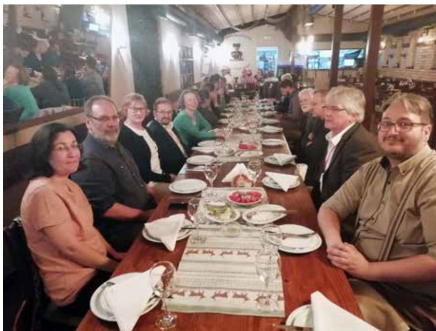
Сл. 5 Заједничка вечера Fig. 5 Community dinner

државу и аутокефалну цркву. То се догодило у тешким временима за византијско царство када у Никеји борави васељенски патријарх, у време успона Епирске деспотовине и дешавања у Охридској архиепископији и Бугарској, када слаби Латинско царство и Солунска краљевина, као и у сложеној ситуацији у јужној Италији и Светој земљи. Проглашење аутокефалности Српске цркве одразило се на културу и уметност међу Србима у свим српским земљама чије наслеђе и данас баштинимо. Овај догађај оставио је видљиви траг на цркву, уметност и политику у Византији и суседним земљама.