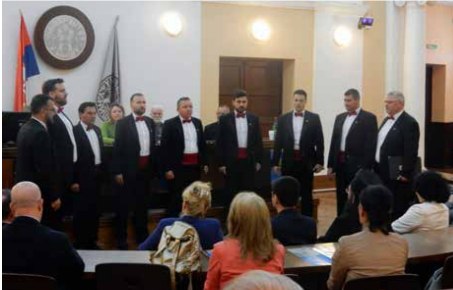
Сл. 4 Свечано отварање скупа, вокална група „Константин“ Fig. 4 Vocal group „Constantine“ performance at the opening

Пре две године обележили смо 800 година од крунисања Стефана Првовенчаног, а тиме и међународно признање Србије као независне државе. Тако смо још једном указали на најзначајни догађај у историји српске државности, али и подвукли узајамну повезаност и међусобну упућеност хришћанских народа и држава.