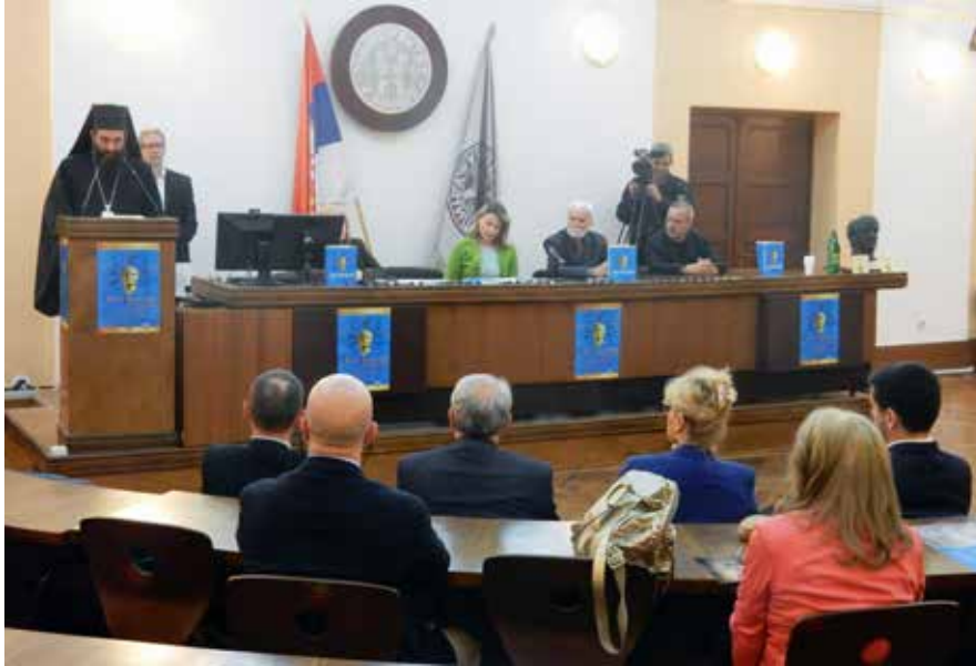
Сл. 2 Благослов Епископа нишког Господина Арсенија Fig. 2 Blessing speech by Niš Bishop Mr. Arsenije