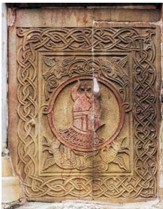
Fig. 2 The coat of arms of Lazarević family, east slab in the south biphora of the exonarthex, photo, Svetozar Petrović

да буде краљ Стефан Дечански, а да се за њено подизање старао Данило II. 6 Хипотезе Ђурчића и Тодића, иако опречне по питању ктитора структуре, представљају значајан допринос разумевању генезе српске архитектуре и скулптуре друге половине 14. века. Њихова тумачења указују на могућност да је декорација фасада моравских цркава условљена обрасцима који су први пут примењени на атонском ексонартексу.