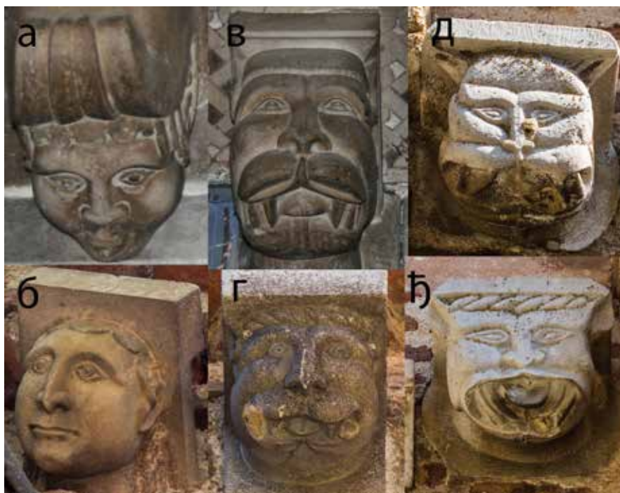
Сл. 7 Конзоле са маскама (а, в – западни портал цркве краља Милутина; б – западна фасада ексонартекса; г – северна фасада ексонартекса; д, и – јужна фасада ексонартекса)