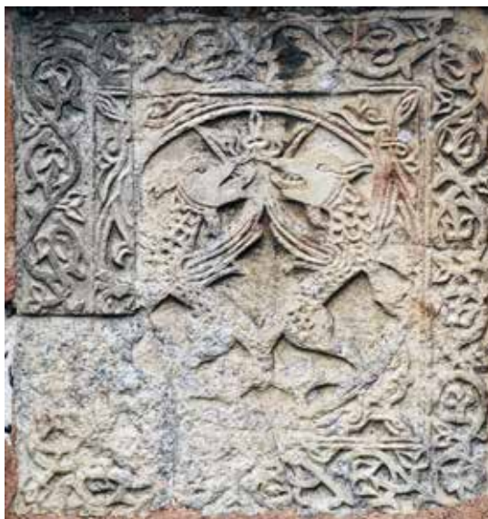
Fig. 5 Addorsed dragons, west slab in the north biphora of the exonarthex, photo, Svetozar Petrović

детаљнију анализу овог грба, али ни преостала два симбола на парапетима северне бифоре. Представе на другим плочама су, по нашем мишљењу, једнако важне и заслужују темељно разматрање. Штавише, значај парапета у северној бифори структуре истакли су и сами неимари будући да су их уградили у највидљивију и најдекорисанију фасаду објекта. 23 Из тог разлога сматрамо да сва три симбола могу да представљају јединствену хералдичку целину која би се односила на ктитора друге фазе радова на спољној припрати.