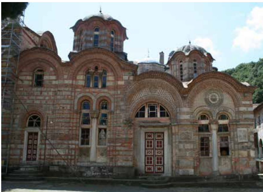
Сл. 1 Нартекс и ексонартекс хиландарског католикона, поглед са севера