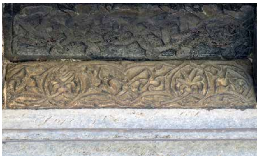
Сл. 12 „Руми“ палмете на фризу изнад северног портала ексонартекса, фото, Светозар Петровић