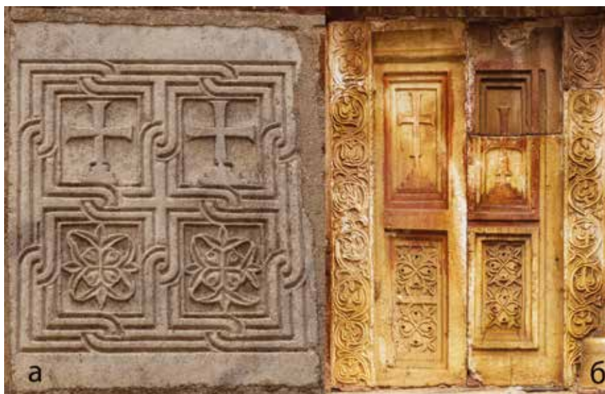
Сл. 8 а – плоча на северозападном ступцу ексонартекса (11 – 12. век); б – западни парапет јужне бифоре ексонартекса