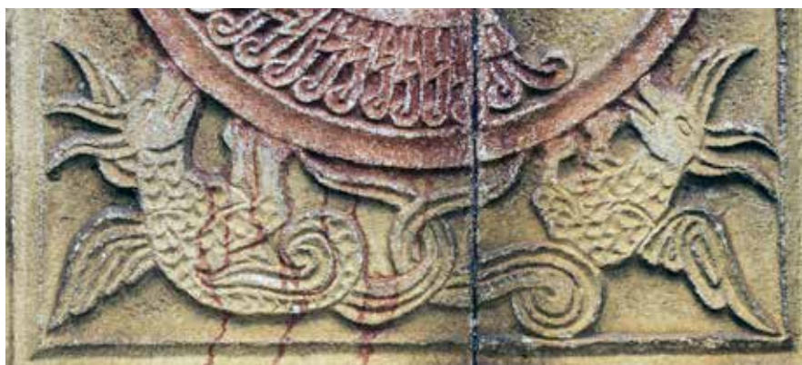
Сл. 9 Аждаје као носачи грба Лазаревића, детаљ, источни парапет јужне бифоре ексонартекса, фото, Светозар Петровић