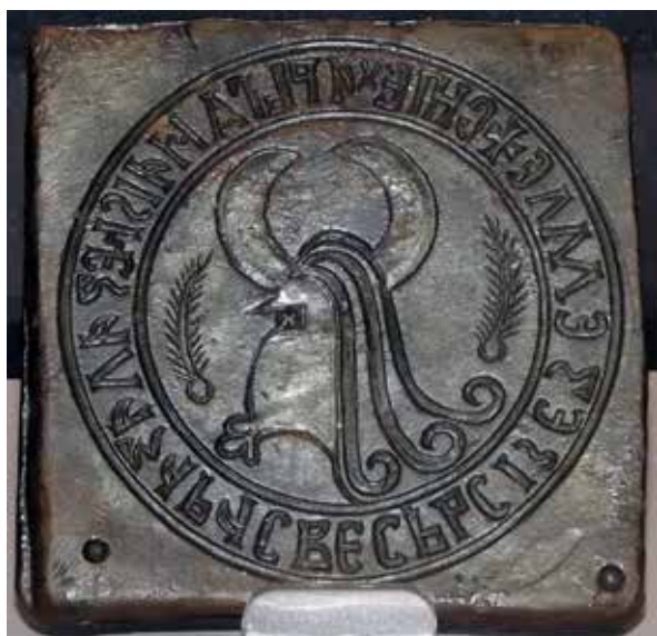
Сл. 3 Типар кнеза Лазара, Народни музеј у Београду, фото, аутор