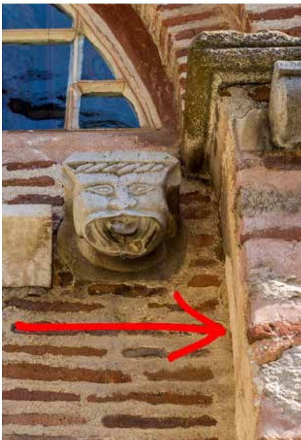
Сл. 6 Остаци фреско – малтера из 14. века на западној фасади цркве краља Милутина на које належе каснији зид у аркади јужне фасаде ексонартекса, фото, Светозар Петровић