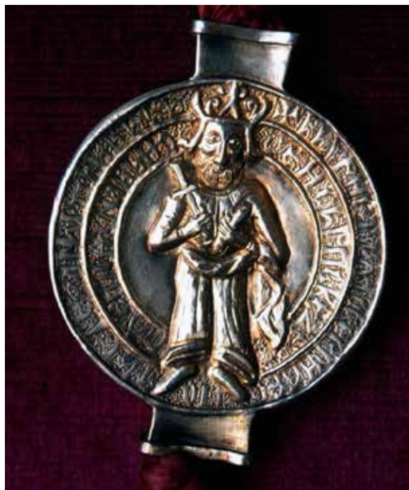
Fig. 10 The seal of despot Stefan from the charter issued to the Hilandar monastery

грба Лазаревића могле би да буду значајан аргумент у корист хипотезе да је на плочи исклесан хералдички симбол деспота Стефана. Опште је познато да је деспот Стефан због блиског политичког савезништва са угарским краљем Жигмундом Луксембуршким добио почасно место у витешком реду Змаја који је овај владар основао 12. децембра 1408. године. 35 Деспот се потписивањем оснивачке повеље обавезао на ношење посебних орната и истицање обележја Реда. 36 Због тога се може претпоставити да је у једном тренутку, као и остали чланови, у свој породични грб могао да инкорпорира приказе змајева, односно аждаја. На већини познатих угарских хералдичких обележја змај је обично обмотан око централног мотива у виду штита. Фрагменти оваквих грбова пронађени су и током ископавања Београдске тврђаве на локалитету деспотове палате. 37 Том приликом ипак нису откривена хералдичка обележја Стефана Лазаревића, већ краља Жигмунда која су сасвим сигурно чинила део орнаментике