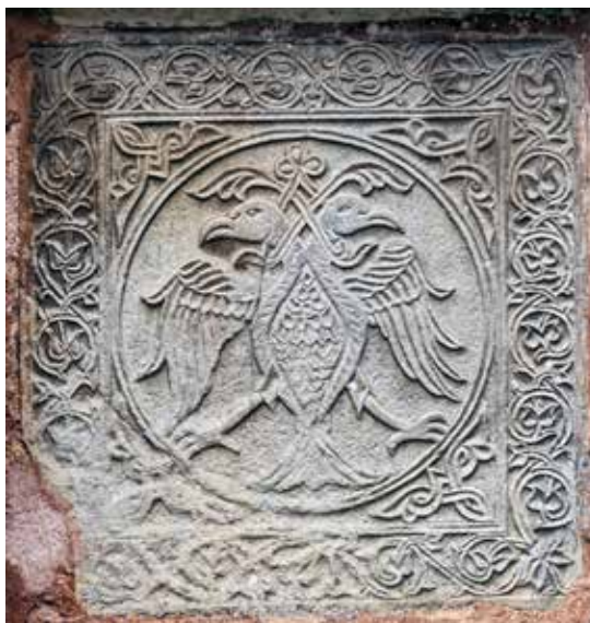
Fig. 4 Double – headed eagle, east slab in the north biphora of the exonarthex

Поред ове плоче, у северној бифори, налазе се још два парапета са хералдичким мотивима. На источном парапету приказан је двоглави орао, а на западном пар адосираних животиња које су идентификоване као аждаје или грифони (сл. 4, 5). Веза између ова три симбола није у потпуности разјашњена. Сретен Петковић је помишљао на могућност да су у питању грбови различитих властеоских породица. 13 Војислав Кораћ је претпоставио да све плоче нису исклесане у исто време као симболи једног владара. 14 Такве тврдње одбацио је Владислав Ристић сматрајући да је декорација свих парапета, због блиског начина клесања и истоветне дубине резаног пластичног украса, морала да настане у исто време. 15 Он је уједно изнео и јаснију аргументацију која указује на могућност да неки од приказаних мотива могу да представљају обележја деспота Стефана Лазаревића, а не кнеза Лазара. 16