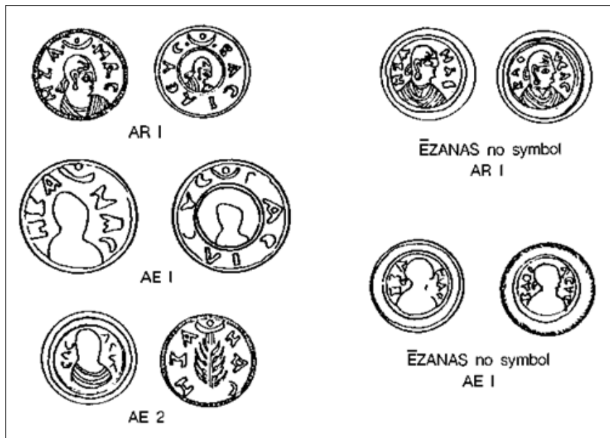
Сл.1 Цртежи златних, сребрних и бронзаних аксумских новчића (R=10-16mm) са ликом краља Езана и крстом на реверсу; симбол крста постаје заједнички на свим аксумским новчићима после прихватања хришћанства.