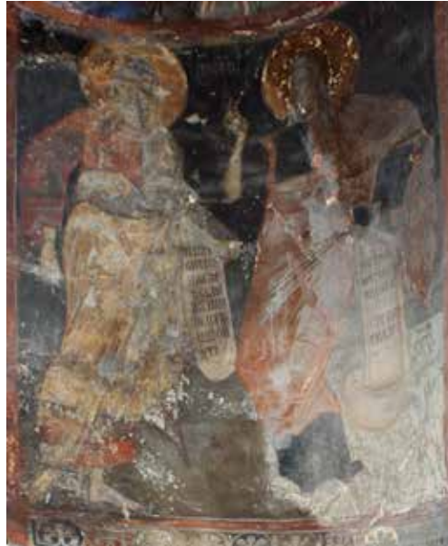
Εικ. 8. Προφήτες Ησαΐας και Ιερεμίας