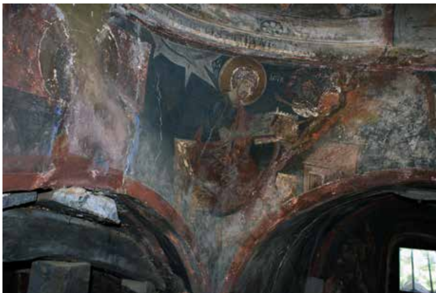
Εικ. 3. Ο ευαγγελιστής Μάρκος Сл. 3 Еванђелиста Марко