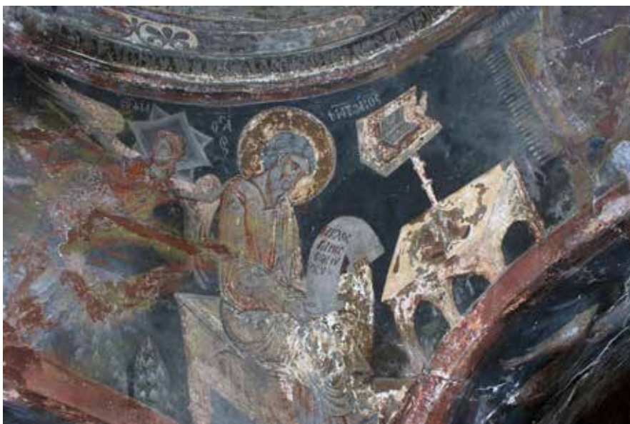
Εικ. 2. Ο ευαγγελιστής Ματθαίος Сл. 2 Еванђелиста Матеј