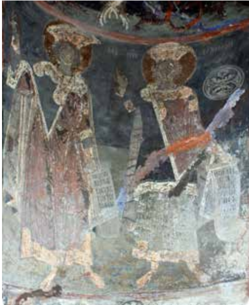
Εικ. 7. Προφήτες Δαβίδ και Σολομών