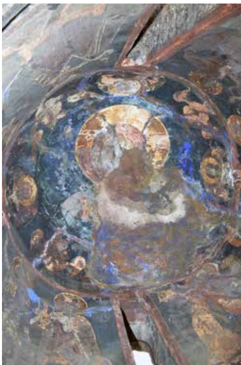
Εικ. 1. Χριστός Παντοκράτωρ Сл. 1 Христ Пантократор