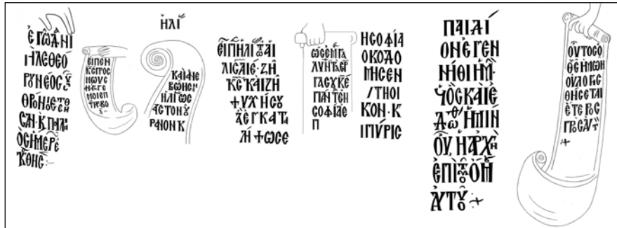
Σχ. 1 Κείμενα ειληταρίων προφητών