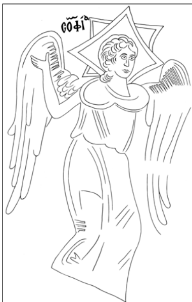
Σχ. 4 Η του Θεού Σοφία