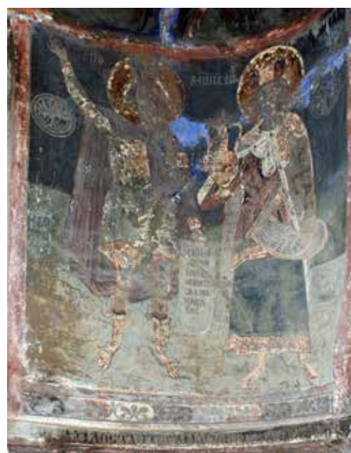
Εικ. 5. Προφήτες, Δανιήλ και Μωϋσής Сл. 5 Пророци Данило и Мојсије