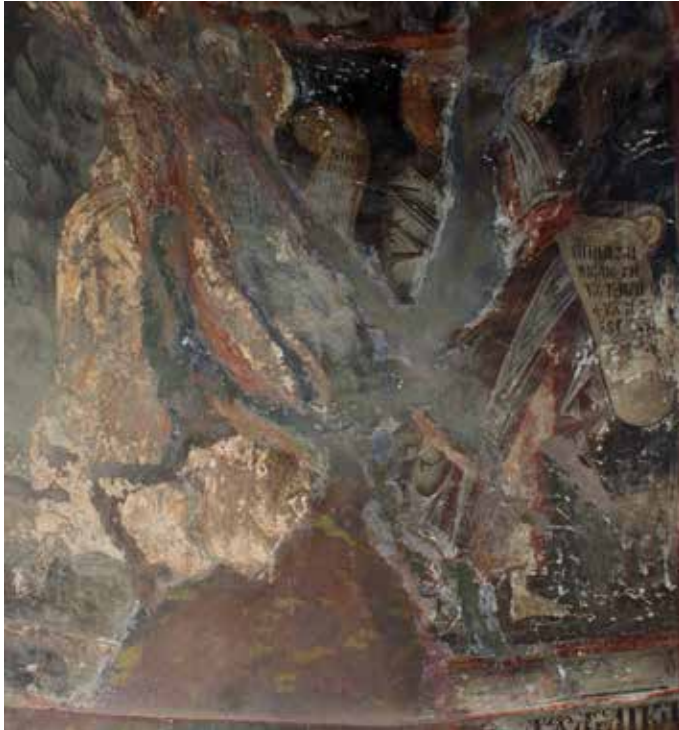
Εικ. 6. Προφήτες, Ηλίας και Ελισαίος