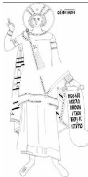
Σχ. 5 Προφήτης Σολομών