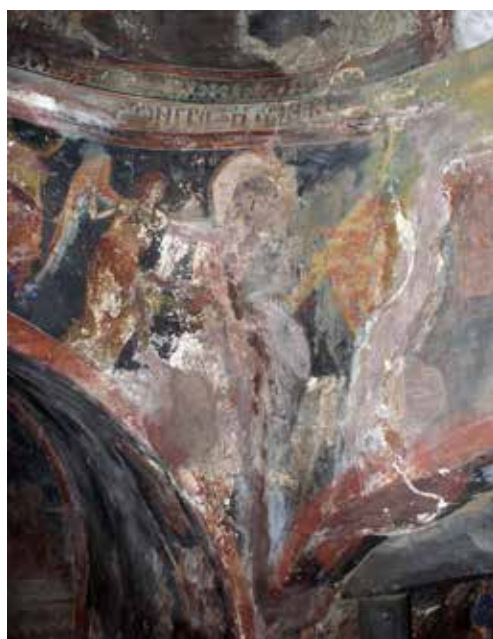
Εικ. 4. Ο ευαγγελιστής Λουκάς Сл. 4 Еванђелиста Лука