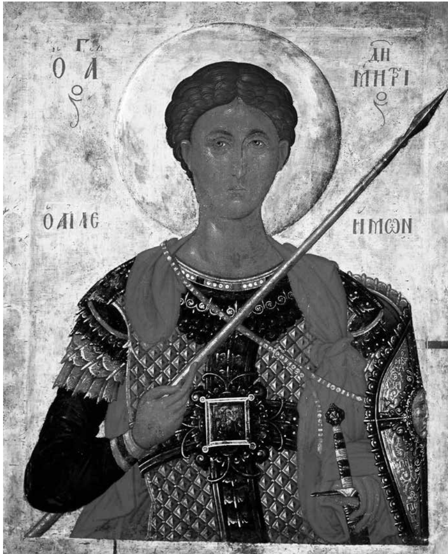
Сл. 1. Свети Димитрије, икона из Марковог манастира, 1365–1377. Музеј Македоније, Скопље (према Miljković-Pepек, An unknown treasury )