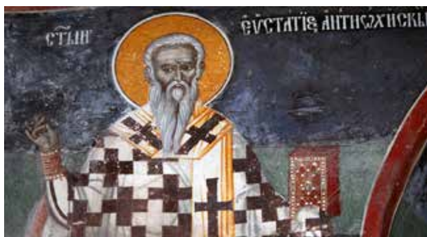
Сл. 5. Манастир Морача, Параклис Светог Стефана, свети Јевстатије Антиохијски