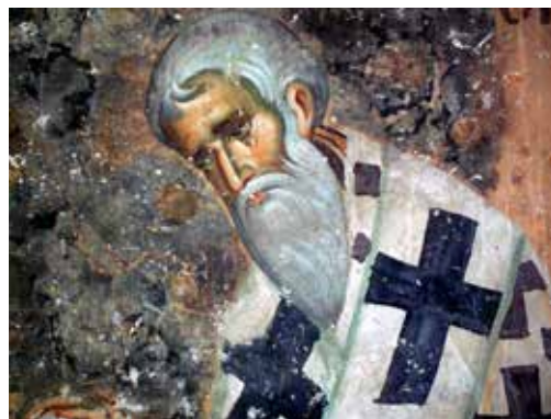
Сл. 6. Манастир Сопоћани, антиохијски светитељ из Службе архијереја

Још једна занимљива српска фреска значајна за проблем који нас занима, али, нажалост, ни њена идентификација и тумачење не могу бити сасвим поуздани. Реч је о представи последњег у низу светитеља на крају јужног дела поворке архијереја у апсиди цркве Свете Тројице у Сопоћанима (сл. 6). Ту је, иза фигуре светог Саве Српског, насликан један антиохијски свети епископ, о чему сведочи фрагментарно очувана легенда: тиε | <ан>тиохи|ски . 65 Сви изучаваоци сопоћанског сликарства сматрали су безрезервно да је реч о светом Игњатију Богоносцу, другом или трећем епископу Антиохије после светог Петра. 66 На такву идентификацију, осим остатка имена („ тиε “),