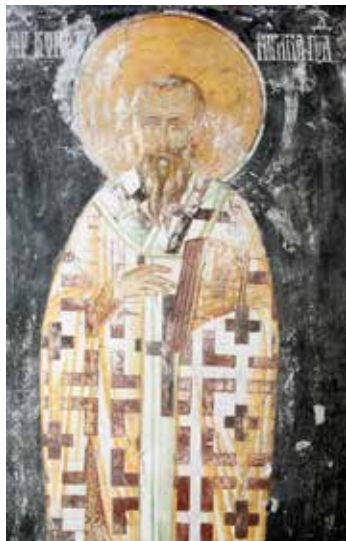
Сл. 3. Богородичина црква у Студеници, Свети Прокло Цариградски

Fig. 3. Studenica monastery, Church of the Theotokos, St. Proclus of Constantinople