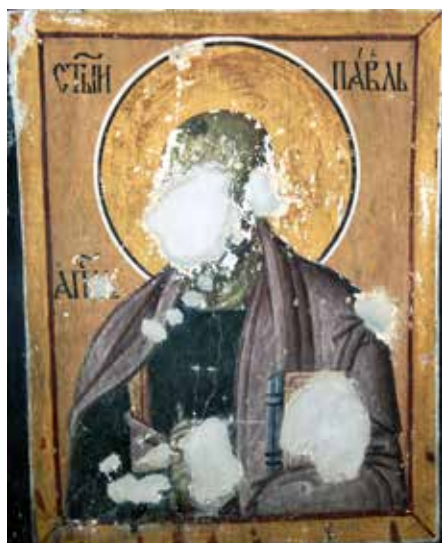
Сл. 10. Богородичина црква у Студеници, Свети Павле

Fig. 10. Studenica monastery, Church of the Theotokos, St. Paul