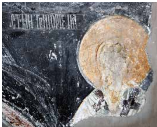
Сл. 2. Богородичина црква у Студеници, Свети Григорије Палама (?)

кон'ста/н'тина град(а). 16 На средини доње половине источног зида северног студеничког вестибила смештена је ниша украшена представом Христа на престолу. 17 На отвореној књици коју Господ придржава левом руком је текст из Јеванђеља по Јовану (15, 17) 18 : СИЕ ЗАПО|ВѢДАЮ ВАМ | ДА ЛЮБИТЕ | ДРЪГЪ | ДРЪГА ИО|ГОДАПОЗ. 19 Коначно, на јужној страни лука вестибила насликан је свети мелод Козма Мајумски, 20 одевен у монашку одећу и турбан и означен као с(вѐ) тьи / коз'ма | твор'ць. 21 На свитку што га песник држи у левој руци исписано је: ДЕВЫ И Ѡ|Т'РОКОВИ|ЦѢ СЪ МАРИ|ТАМЪ ПРОРОЧИ|ЦКЮ ПѢС(ѐ) НЬ | ИС'ХОДНЮ. 22 У темену лука је