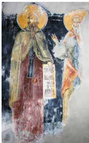
Сл. 1. Богородичина црква у Студеници, Свети Кирил Филозоф и неидентификовани свети монах

Fig. 1. Studenica monastery, Church of the Theotokos, St. Cyril the Philosopher and an unidentified saint monk