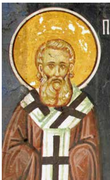
Сл. 7. Пећка патријаршија, припрата, Менолог, свети Прокло Цариградски

Fig. 7. Patriarchat of Peć, narthex, Menologion, St. Proclus of Constantinople