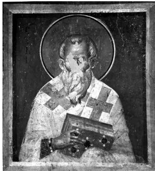
Сл. 8. Манастир Жича, свети Прокло Цариградски