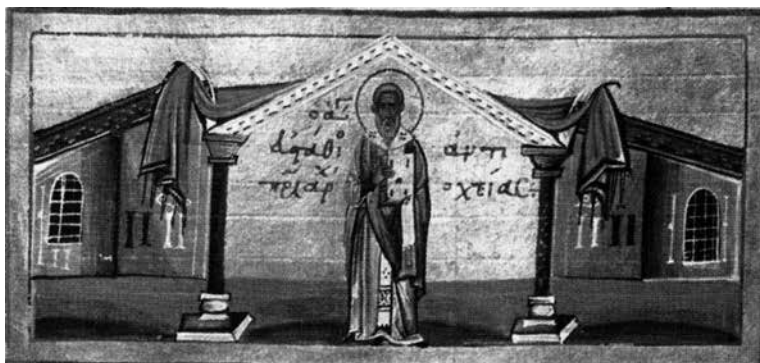
Fig. 4. Moscow, State Historical Museum, Sin. grech. № 183, fol. 103r, St. Eusthathius of Antioch

уочен значај охридских светитељских култова, односно тамошњих програмских и иконографских образаца за уобличавање сликаног програма Богородичине цркве у Студеници, 58 онда се озбиљно мора помислити на могућност да је у задужбину Симеона Немање у доба архимандрита Саве са охридских иконографских источника доспела и представа светог Јевстатија Антиохијског. 59