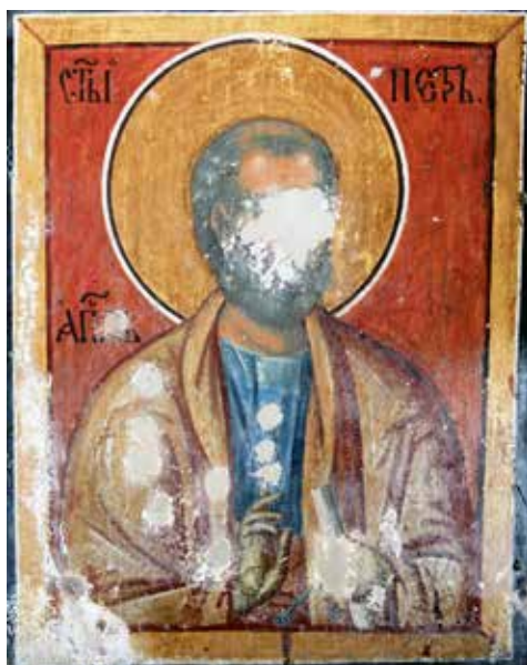
Сл. 9. Богородичина црква у Студеници, Свети Петар