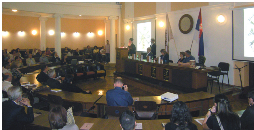
Сл. 1 Његова Светост Патријарх српски Господин Иринеј, свечано отварање симпозијума „Ниш и Византија X“, свечана сала Универзитета у Нишу Fig. 1 His Holiness Patriarch of Serbia Mr. Irinej, opening ceremony of the symposium “Niš and Byzantium X“, Niš University Hall