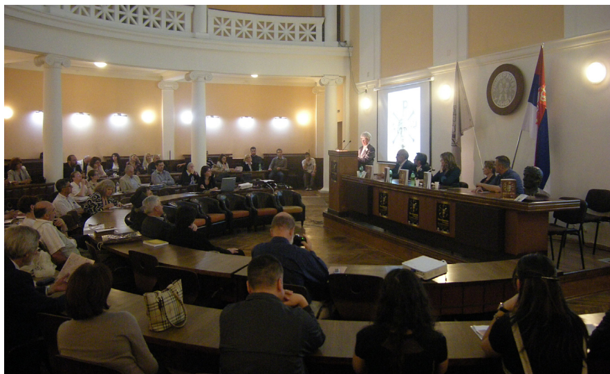
Сл. 2 Академик проф. др Ренате Пилингер (Беч), свечано отварање симпозијума „Ниш и Византија X“