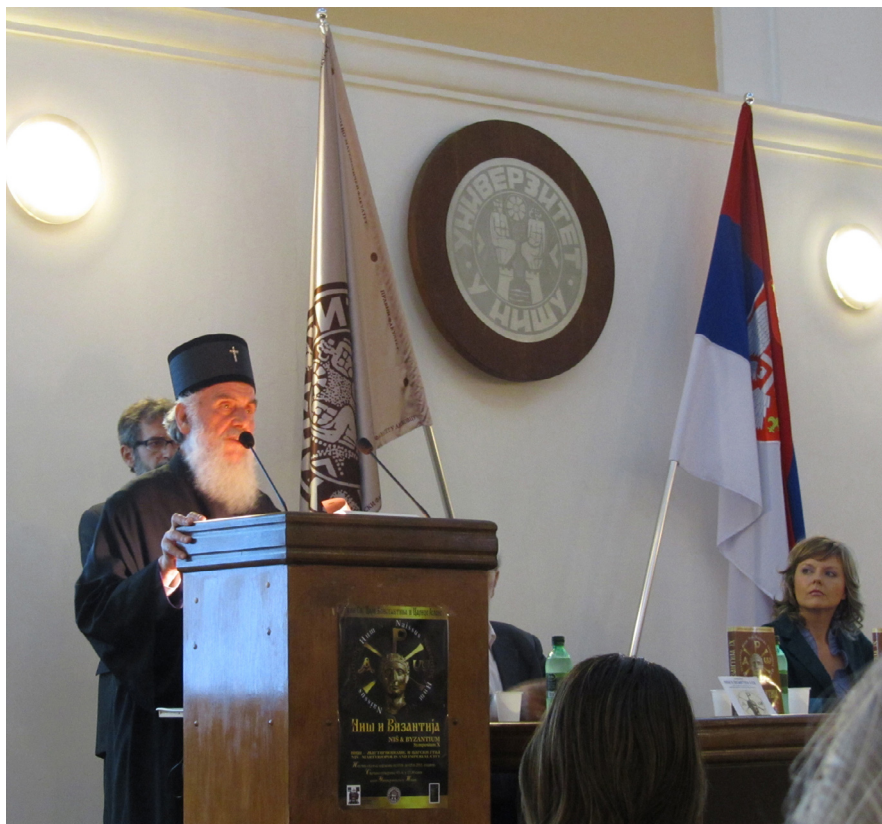
Сл. 1а Патријарх српски Господин Иринеј Fig. 1a Patriarch of Serbia Mr. Irinej

делом византијске цивилизације, уметности и културе. Прошлост Наисуса, Наисоса, Нисоса и Ниша , умногоме је јаснија а њена реконструкција и ревитализација споменичког наслеђа захваљујући новим знањима извеснија, у догледно време и могућа.