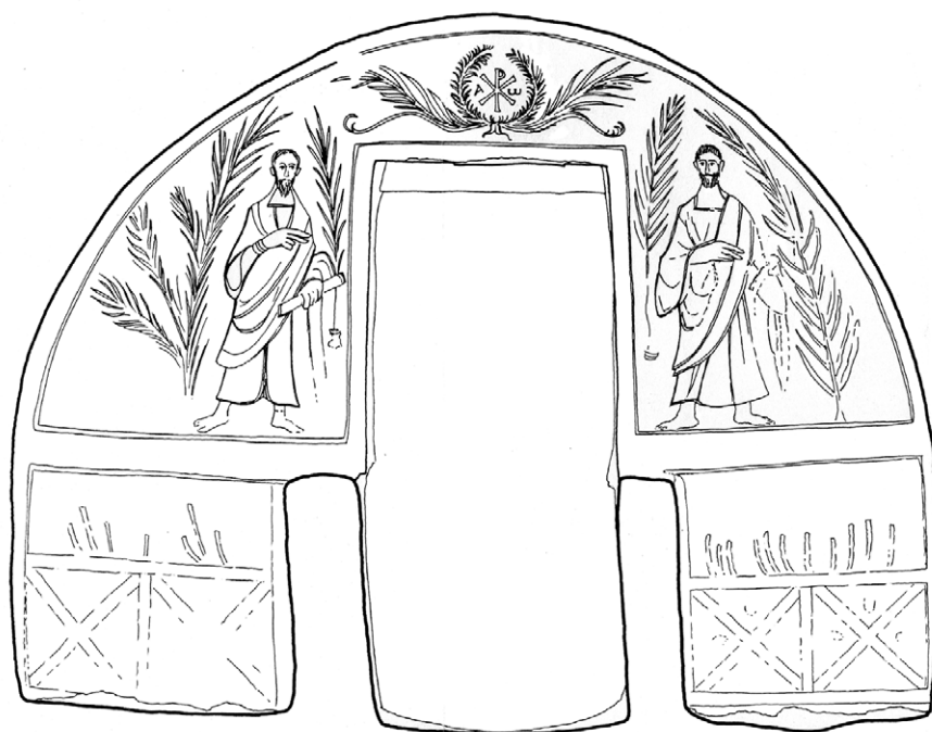
Сл. 3. Гробница са фигуралним представама, Источни зид гробнице, цртеж Б. Пешић Сл. 3. Гробница са фигуралним представама, Источни зид гробнице, цртеж Б. Пешић

Официјални симбол града – палмину грану, затичемо у оквиру декорације на оловном тегу откривен у порти цркве Св. Пантелејмона. Да је упитању прихваћен симбол града указује и чињеница да се налази на крају натписа - P(ondo) I(undo) N(aissi), уз слово „N“ које означава име града. На тај начин је сведена персонификација града у облику палмове гранчице. 31 За оновремени Наисус палмова грана је била јасан и препознатљив симбол мартриополиса , у коме су се чувале чудотворне мошти мученика по којима је био познат у оновременом хришћанском свету. Палмином граном је јасно означен град мученика, исто онако, како је согона тагуит препознатљив венац на глави мученика.