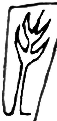
Сл. 2. Оловни тег, детаљ орнамента