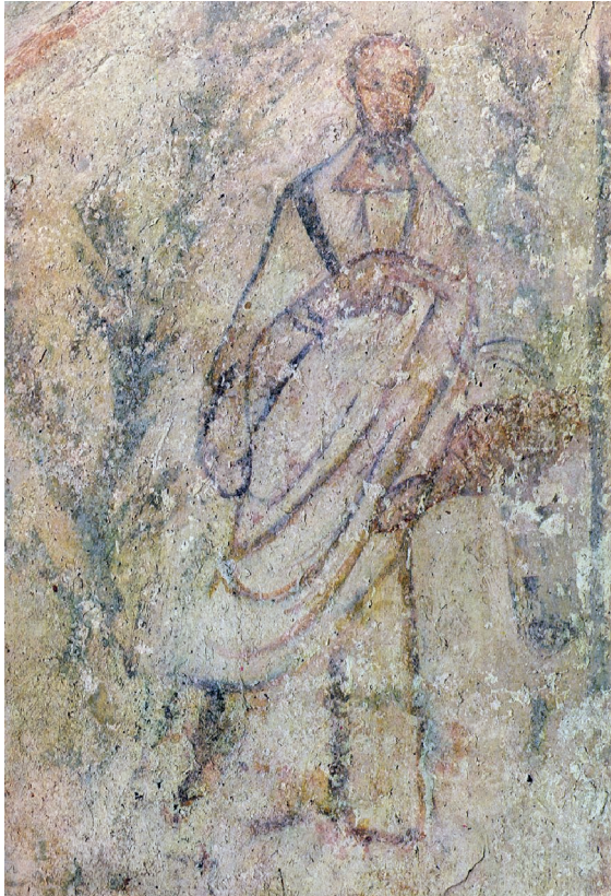
Сл. 4. Гробница са фигуралним представама, источни зид, детаљ са граном палме, северна фигура