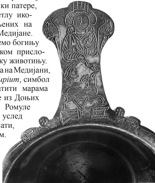
Сл. 4. Дршка патере, Доњи Бранетићи, Рудник

мали коњ. 17 Међутим, идентификација богиње, представљене на дршки патере, може се посматрати и у светлу иконографских решења заступљених на споменицима из Ромуле и Медијане. Наиме, у сва три случаја срећемо богињу у набораној хаљини која, руком прислоњеном на груди придржава неку животињу. Божанство, чија је статуа нађена на Медијани, у другој руци држи кесу- marsupium , симбол благостања, како се могу схватити марама и клас на представи са патере из Доњих Бранетића. На рељефу из Ромуле атрибут у богињиној руци се, услед оштећења, не може дефинисати, али на другом, фрагментованом рељефу са истог локалитета, на коме је, вероватно, као и на оном боље сачуваном, представљено божанство Дарданије, поред богиње се налази посуда са воћем или хлебовима, што је представа која, такође, симболише благостање. Истог карактера је и