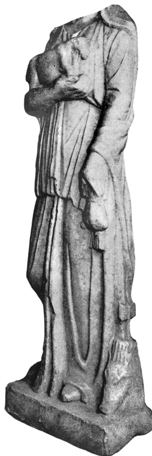
Сл. 1а. Статуа, Mediana

Елементи иконографског концепта ове богиње који повезују споменике из