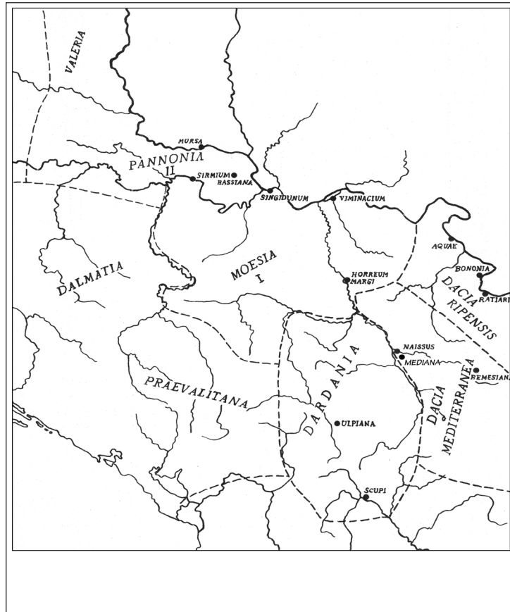
Сл. 8. Централнобалканске провинције Касног царства (према: М. Мирковић, Историја српског народа I, 1981, 93)