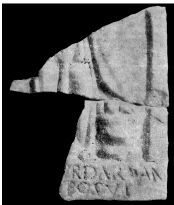
Сл. 3. Рељеф, Romula