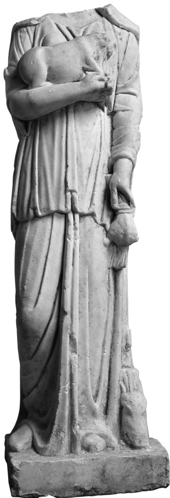
Сл. 1. Статуа, Mediana