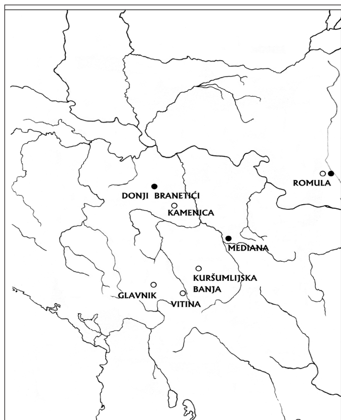
Сл. 5. Налази споменика посвећених божанству Дарданије:

● фигуралне представе; ○ епиграфски споменици