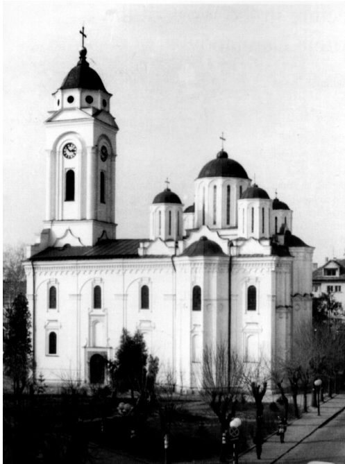
Сл. 4. Црква Св. Георгија у Смедереву (1851-1855), поглед са југоистока

Србији и Војводини, 22 док су у Хрватској, Словенији, БиХ и Црној Гори храмове претежно градили архитекти из средње или источне Европе. 23 Грчки неимари су подизали нове или дограђивали постојеће базилике у својим градским средиштима. 24