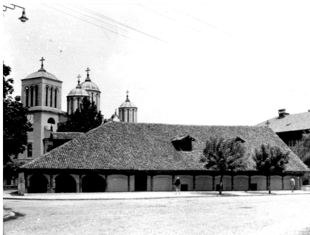
Сл. 2. Мали Саборни и велики Саборни храм (иза) у Нишу

године. 12 Место за зидање изабрано је на парцели североисточно уз порту старе цркве Св. Арханђела, која више није могла да задовољи потребе нарасле хришћанске популације у граду. 13 Саборна црква је првобитно требало да буде посвећена Св. Ђорђу, али је та одлука накнадно промењена. 14 Црква је довршена и освећена у периоду преласка југоисточне Србије у надлежност Београдске митрополије. Њену изградњу имућнији грађани су подржали новчаним прилозима и грађевинским материјалом, док су сиромашнији