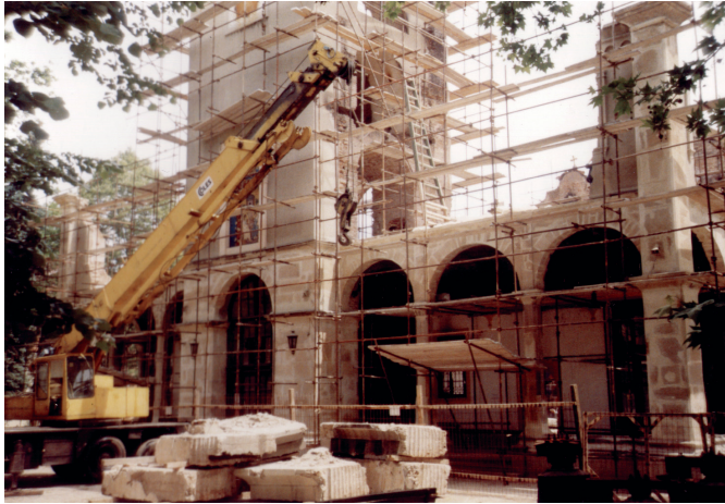
Сл. 7 Црква силаска Св. духа на апостоле, обнова после пожара 2001. године.