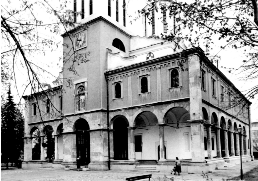
Сл. 5. Црква Силаска Св. духа на апостоле у Нишу, изглед са југозапада (из фототеке З. Маневића)

грађени од трошног и лаког дрвета, доњи зидови и апсиде од нетесаног камена и наизменичног дебелог слоја малтера, прозори такође од малтера, гредни систем од дрвета и малобројних гвоздених полууга. 34 Углови су наглашени јаким ободним ступцима који се протежу кроз све етажне храма. (сл. 5)