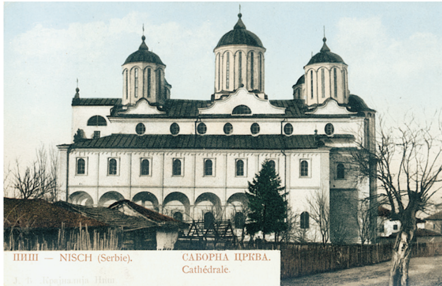
Сл. 1. Црква силаска Св. духа на апостоле у Нишу (1857-1872), изглед са југа, стање пре доградње звоника

Док је у трећој четвртини деветнаестог века у Кнежевини Србији црквена архитектура напредовала у организационом, техничком и естетском погледу, 11 грађење Саборне цркве у Нишу се одвијало у потпуно другачијем амбијенту, у коме су материјална оскудица, културна изолација и политичка несамосталност ограничавали градитељске подухвате српског становништва. Вековима спутавано и потискивано, српско црквено градитељство на окупираним територијама под турском влашћу, почело се слободније развијати под утицајем реформи спроведених половином деветнаестог столећа. Економско јачање српског грађанства, правно изједначеног са муслиманским живљем, као и веће верске слободе, омогућили су изградњу саборних храмова у епископским средиштима.